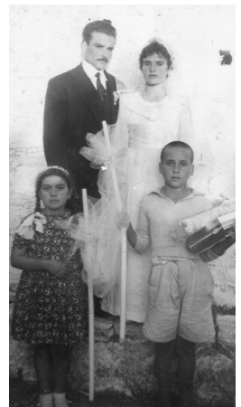
Στο γάμο τους

-Όχι όσο ήμουν στον πατέρα μου, μόνο εδώ στο χωριό. Γιατί είχαμε τα δικά μας χτήματα και δεν προλαβαίναμε. Παίρναμε και εμείς εργάτες, κάναμε και δανεικαριές. Αργότερα που έκανα δι-