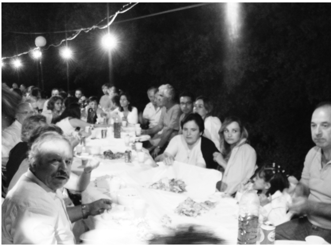
Αύγουστος 2006 στο τελευταίο πανηγύρι στη Μάκιστο

-Η οικογένεια σου έχει μια σημαντική κοινω-