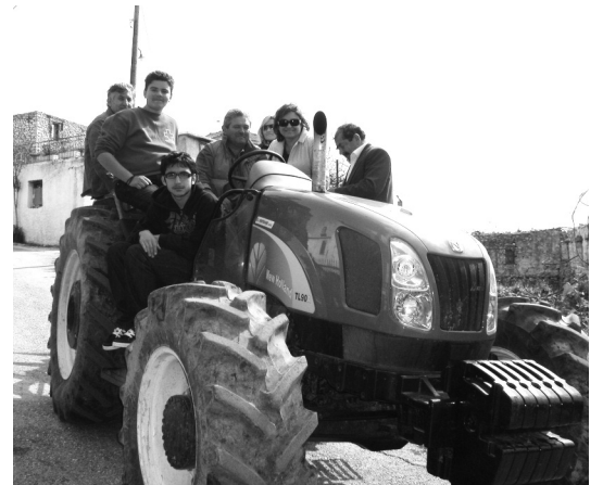
Παιδιά, εγγόνια στο τρακτέρ μετά τη φωτιά