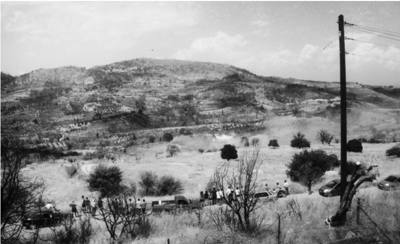
Αύγουστος 2008, φωτιά στο Χρυσόχωρι

Σε επίσκεψή μας το Μάρτιο στο Δημαρχείο, θέσαμε το θέμα αντιπυρικής προστασίας: «Μετά την πυρκαγιά, τα χωράφια δεν καλλιεργήθηκαν με αποτέλεσμα, τα χόρτα να ξεπεράσουν το ένα μέτρο και αφού το καλοκαίρι έρχεται, θα ξεραθούν και θα είναι επικίνδυνα για ανάφλεξη».