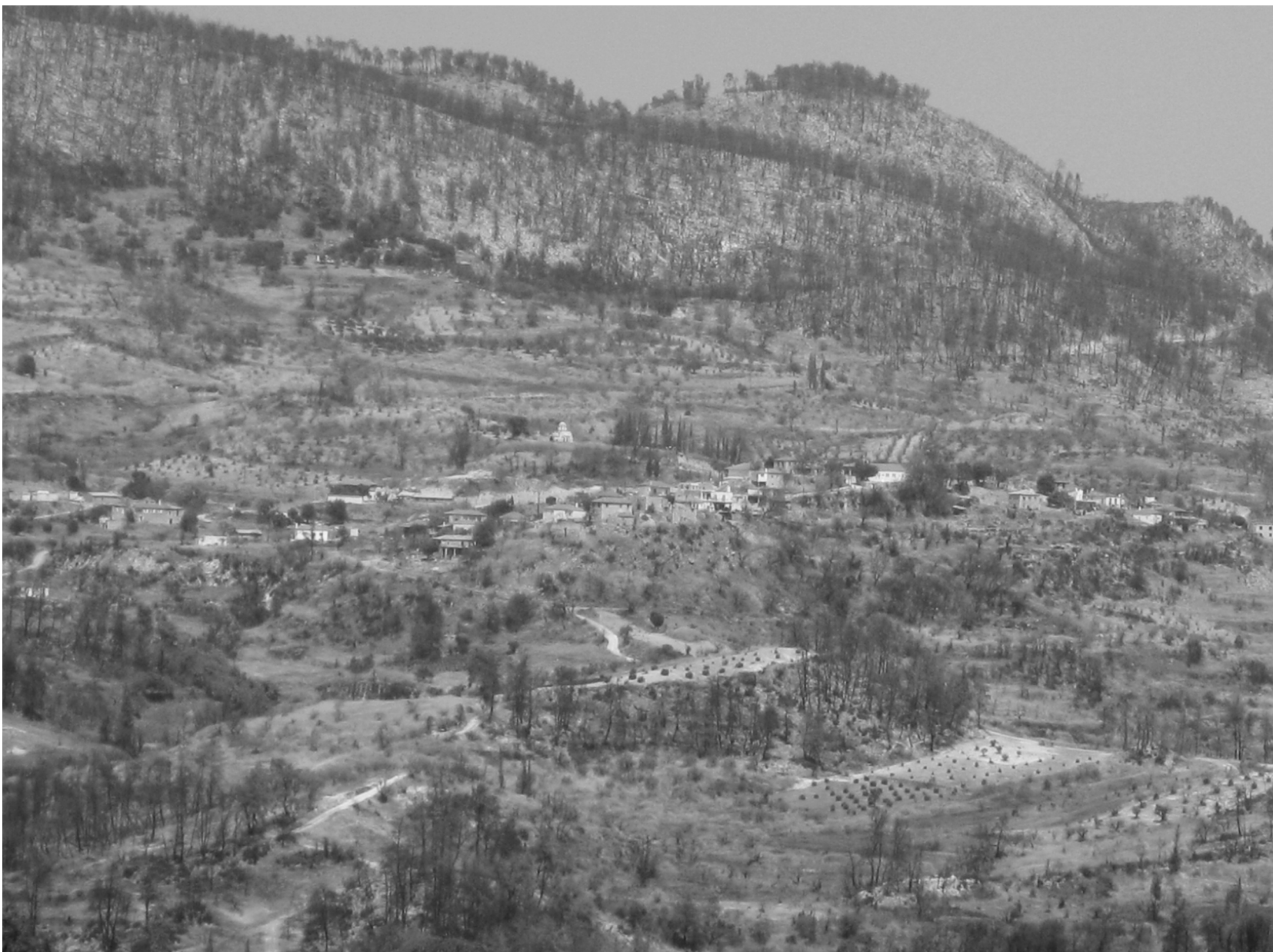
Άποψη του χωριού από τη Μηλέα